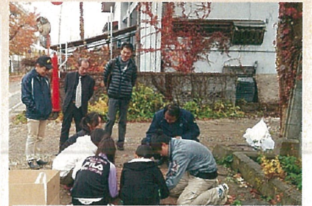
CORQ(コルク)の試験敷設