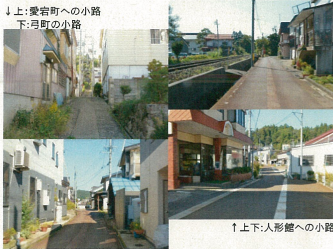
↑上下:人形館への小路