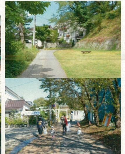
↑上下:城址公園への小路