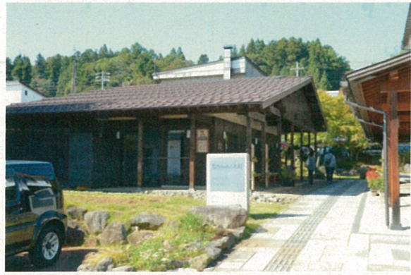
←高橋まゆみ人形館