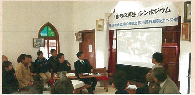
シンポジウムの開催(テーマ:まちの再生)