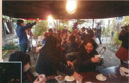
チャペルガーデンパーティー