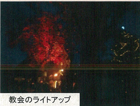
教会のライトアップ