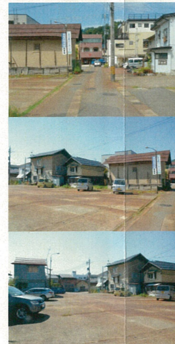
↑上:教会への導入路 中下:広小路パーキング