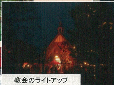
教会のライトアップ