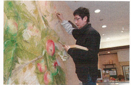
パティスリー・ヒラノにて壁画制作風景

ノルマンディー「サン・ヴィゴール・ド・ミュー礼拝堂の再生プロジェクト」、「琴平山再生計画」で知られる。1999年村野藤吾賞・2000年フランス芸術文化勲章(オフィシエ)受賞。著書に『林檎の礼拝堂』、『表現の現場? マチス、北斎、そしてタクボ』等。