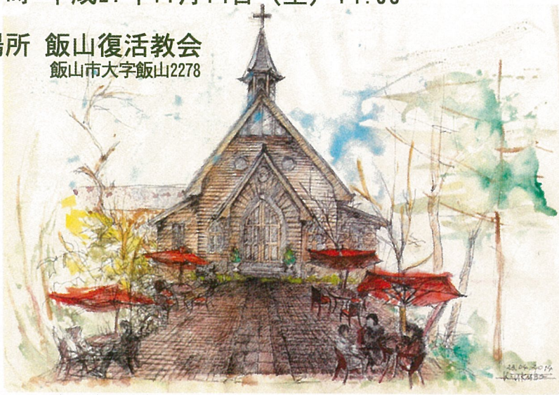
飯山復活教会 再生 イメージデッサン 画：田窪 恭治