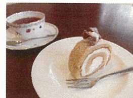
パティスリーヒラノ オリジナル メイプル・ロールケーキ