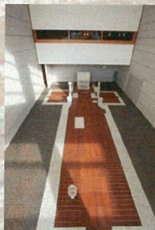
田窪恭治展 風景芸術 (東京都現代美術館 2011)