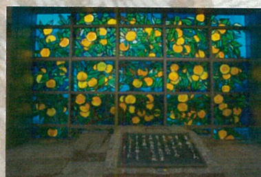
松山空港ロビー ステンドグラス 「蜜柑 ミカン みかん」(2013)