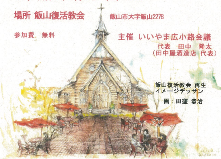
飯山復活教会 再生 イメージデザイン