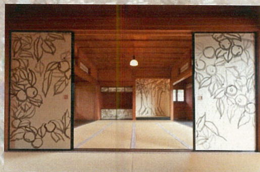
田窪恭治一倉敷の風景にー (大原美術館 2011)