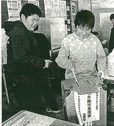
投票箱に投票用紙を入れる下氷鉤小6年生

午後4時半から、モミの木のイルミネーションと教会のライトアップの点灯式がある。催しの途中では、庭でコーヒード、ケーキ、日本酒などを振る舞う。イルミネーションはクリスマスごろまで続ける予定だ。