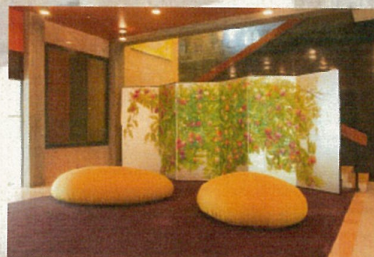
在日フランス大使館公邸 「ノルマンディの林檎」 (2013)