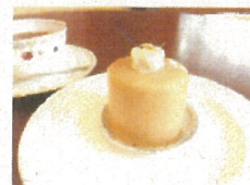
パティスリーヒラノ オリジナル・メイプルケーキ